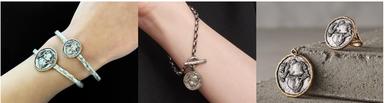
(上)銀座三越先行発売SV925/K18YG petit usagi バングル、(下) SV925/K18YG petit usagi バングル