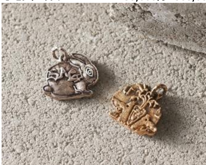
(左)SV925 petit usagi ピアスチャーム、 (右)K18YG petit usagi ピアスチャーム(裏面)