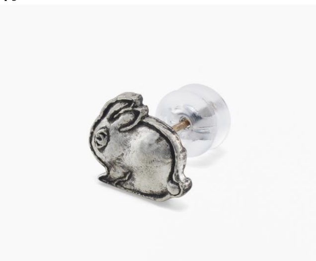
SV925 petit usagi スタッドピアス(シングル)